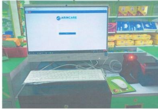
รูปหลังการติดตั้ง

8. สำเนาใบประกอบการร้านขายยา (ใบอนุญาตขายยาแผนปัจจุบัน แบบขย.5 ที่ต่ออายุแล้ว) พร้อมเซ็นสำเนาถูกต้องพร้อมเซ็นสำเนาถูกต้องและลงนามรับรอง