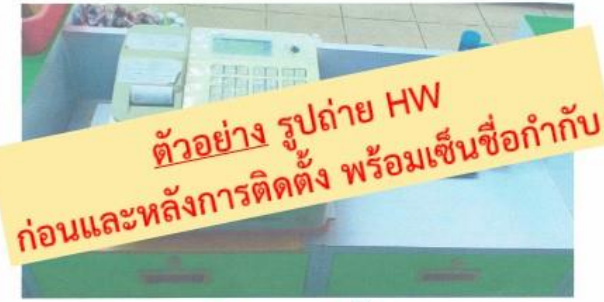
รูปก่อนการติดตั้ง