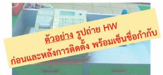
รูปก่อนการติดตั้ง

(ให้ลูกค้าถ่ายรูปก่อนการติดตั้งอุปกรณ์ฮาร์ดแวร์และรูปหลังการติดตั้งฮาร์ดแวร์ พร้อมเปิดหน้าจอเป็นโปรแกรม Arincare ปรี้นท์แล้วลงชื่อกำกับแนบมากับเอกสารตัวอื่นๆ)