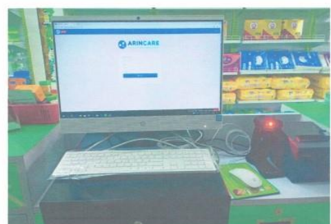
รูปหลังการติดตั้ง