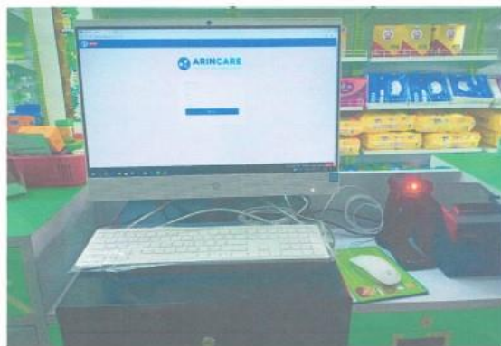
รูปหลังการติดตั้ง

2.7 สำเนาใบเสร็จการซื้อขาย พร้อมเซ็นสำเนาถูกต้อง