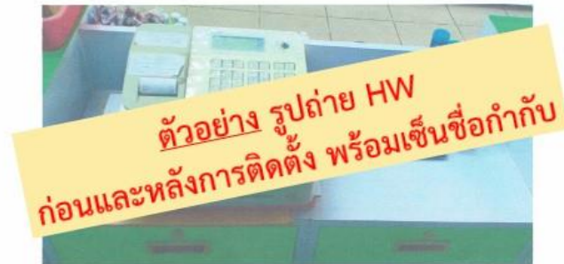
รูปก่อนการติดตั้ง

(ให้ลูกค้าถ่ายรูปก่อนการติดตั้งอุปกรณ์ฮาร์ดแวร์และรูปหลังการติดตั้งฮาร์ดแวร์พร้อมเปิดหน้าจอเป็นโปรแกรม Arincare ปรีนทร์แล้วลงชื่อกำกับแนบมากับเอกสารตัวอื่นๆ)